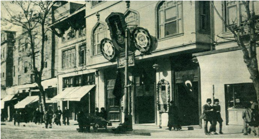
Resim 6. Dârü'l-bedâyi, Osmanlı Dönemi ilk konservatuvar

Mûsikî bölümünün kapatılmasından sonra faaliyetlerine devam eden tiyatro bölümü, muhtelif sebeplerden dolayı sık sık kapanma noktasına gelmiş, 1931 yılında İstanbul Belediyesi'ne bağlı olarak İstanbul Şehir Tiyatrosu adını almıştır (Toker ve Özden, 2013).