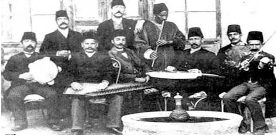
Resim 3. Sultan Abdülmecid döneminde meşkhane