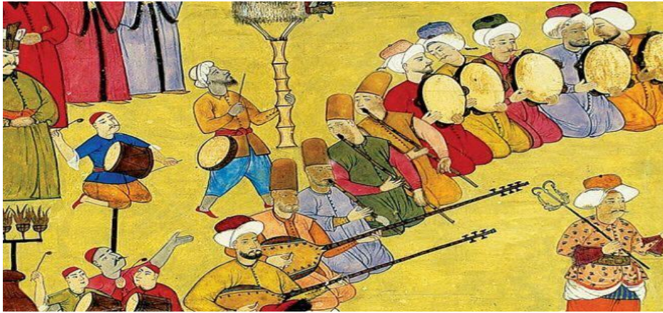
Resim 2. Enderun'da mûsikî

“Dersler hazine ve has odalı mûsikîşinas Enderûnlular tarafından verildiği gibi, saray dışından tutulan maaşlı öğretmenler tarafından da verilmiştir. Bu hocalar İstanbul'daki en usta hânende ve sâzendeler arasından seçilmişlerdir. Derslere “meşkhâne” adı verilen odada haftanın belirli günlerinde saat dokuz civarında başlanmıştır. Öğlene kadar Türk Müziği (Sâzendegân-ı Hâssa) öğlenden akşam saatlerine kadar, rakkaslar ve mukallitler (dansçılar ve soytarılar), akşam vakitlerinde ise mehter takımı eğitim görmüştür” şeklinde açıklamıştır (2013: 110).