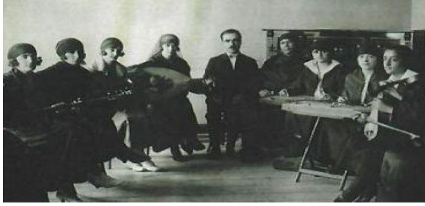
Resim 7. Dârü'l-Elhân (20. yy.)