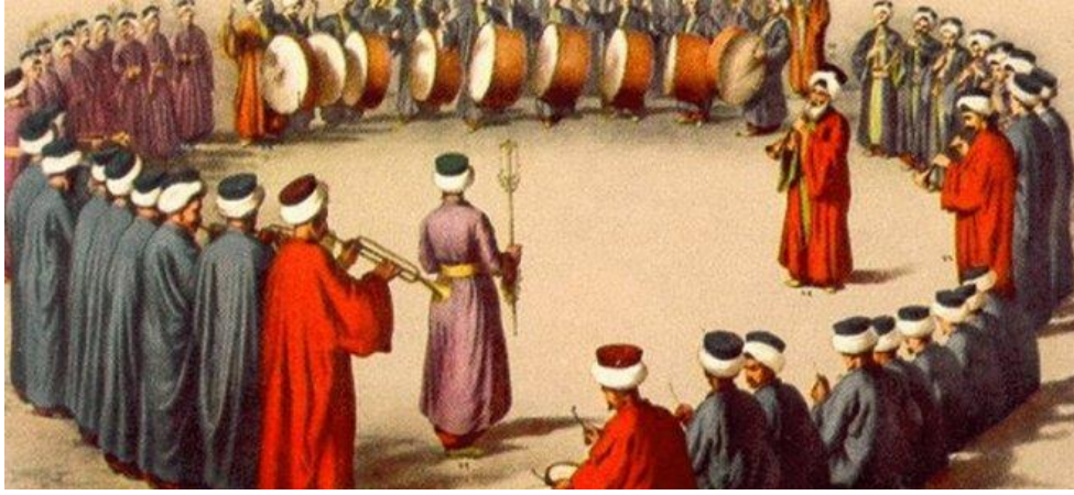
Resim 4. Konser düzeninde Mehter (Nevbet)

Mehterin işlevleri arasında şüphesiz en mühim olanlarından biri de savaş zamanı düşmanı psikolojik baskı ile korkutmak ve orduyu cesaretlendirmektir (Kahramankaptan, 2009). Böyle bir işleve sahip bir kurum olan Mehterhane 1826 yılında II. Mahmud zamanında, Yeniçeri Ocağı ile beraber kapatılır.