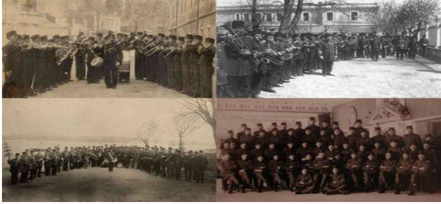
Resim 5. Mûzikâ-i Hümâyûn Osmanlı Askeri Saray Bandoosu, Mehter yerine klasik Batı Orkestrası, Osmanlıda Modernleşme (19. yy.)